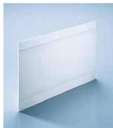
De 8 mm dikke StoReno Plan pleisterdragerplaat is voorzien van verzonken groeven voor het pluggen.