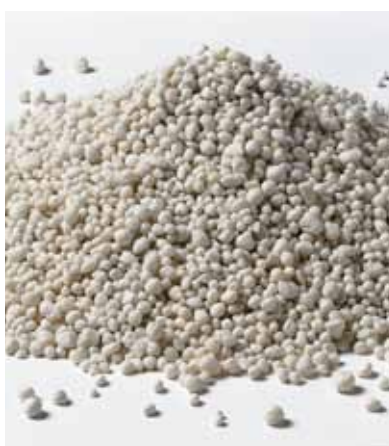
Het glasgranulaat wordt met bindmiddel tot de StoReno Plan plaat gevormd.