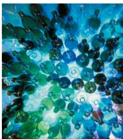
De StoReno Plan plaat bestaat voor 96% uit gerecycleerd glas.